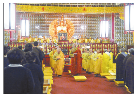
1976年和現在的大殿 The Buddha Hall: 1976 and now