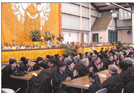
1970年代和現在的五觀齋堂 The Dining Hall: the 1970s and now