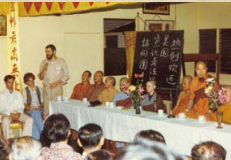
左上圖：鶴鳴寺歡迎籌委會中，上人開示。