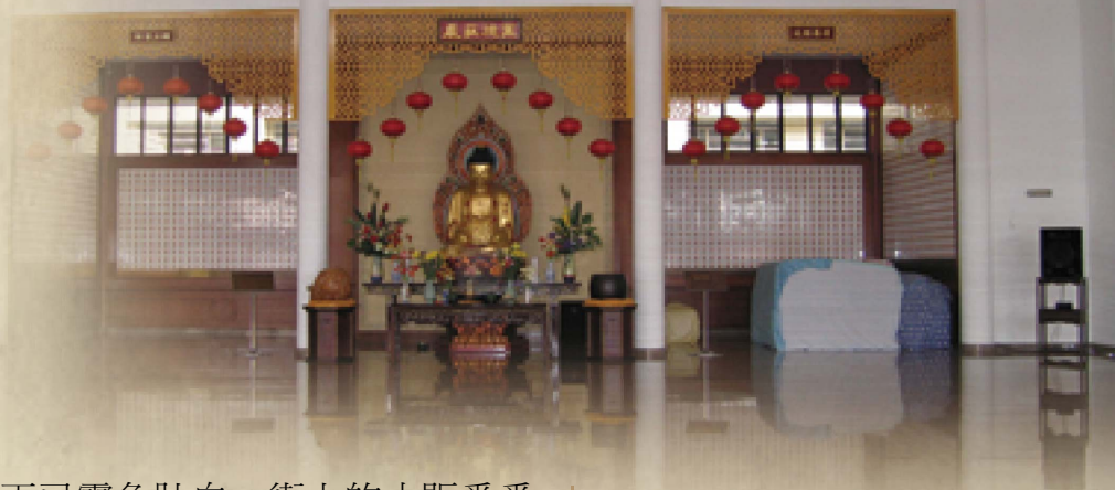
圖：2005年10月攝 鶴鳴寺大殿。

廟雖沒有什麼裝潢，但純樸整潔，予人親切的感覺。廟裡的石階、牆壁，都洋溢著融和的氣氛；最奇怪的，我們對每一個角落，似乎早已熟悉透了。